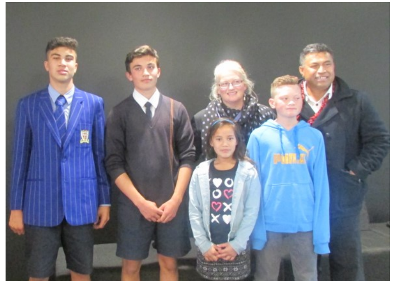
O ni vaaiga i Haeata Aranui i le vaiaso na se'i tuana'i, i le faamoemoe mo fanau Pasefika a Karaiesetete: Ata—OLA 2017