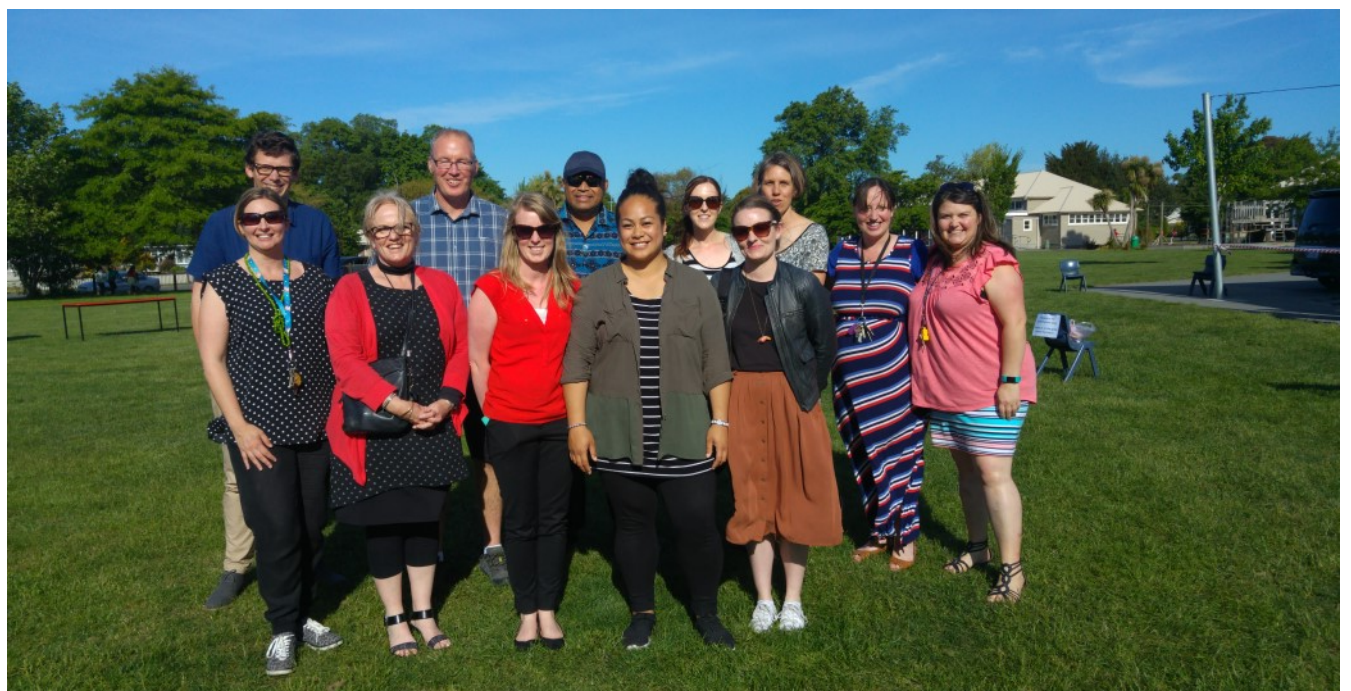
Ata i luga a'e matua a RP maimoa i faafiafiaga; i luga faia'oga ma le pulega a le a'oga