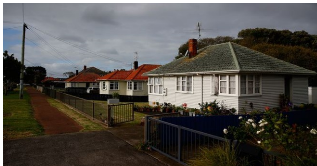
Se atufalega o fale tuufua o le malo

Sa afea i lana tala se molimau o ni tagata faigaluega a le Housing na auina atu i Sini Ausetalia e faalauiloa ai