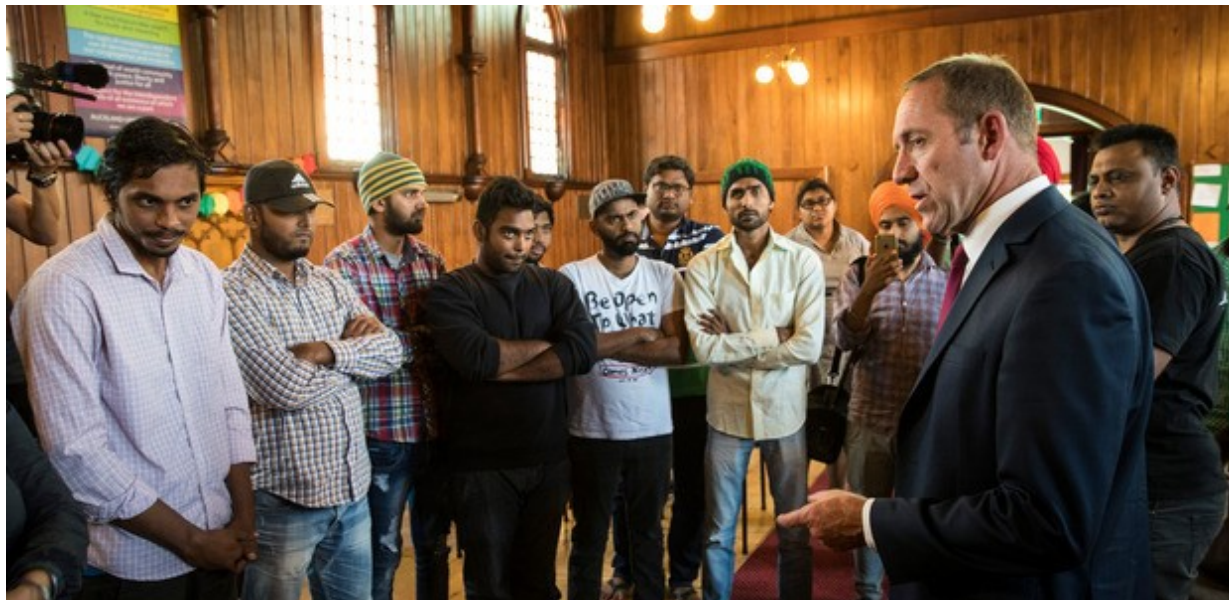
To'atele le au fia fesoasoani i le mafatia o nai alii Initia; pei o le ta'ita'i o le Itu Agai, Andrew Little

Ua tuu atu le tau'au o le lotu i le amoina o le avega o loo feagai ma fanau a'oga mai Initia, talu le faamata'u a le malo e ave ese faamalosi i latou mai le atunuu.