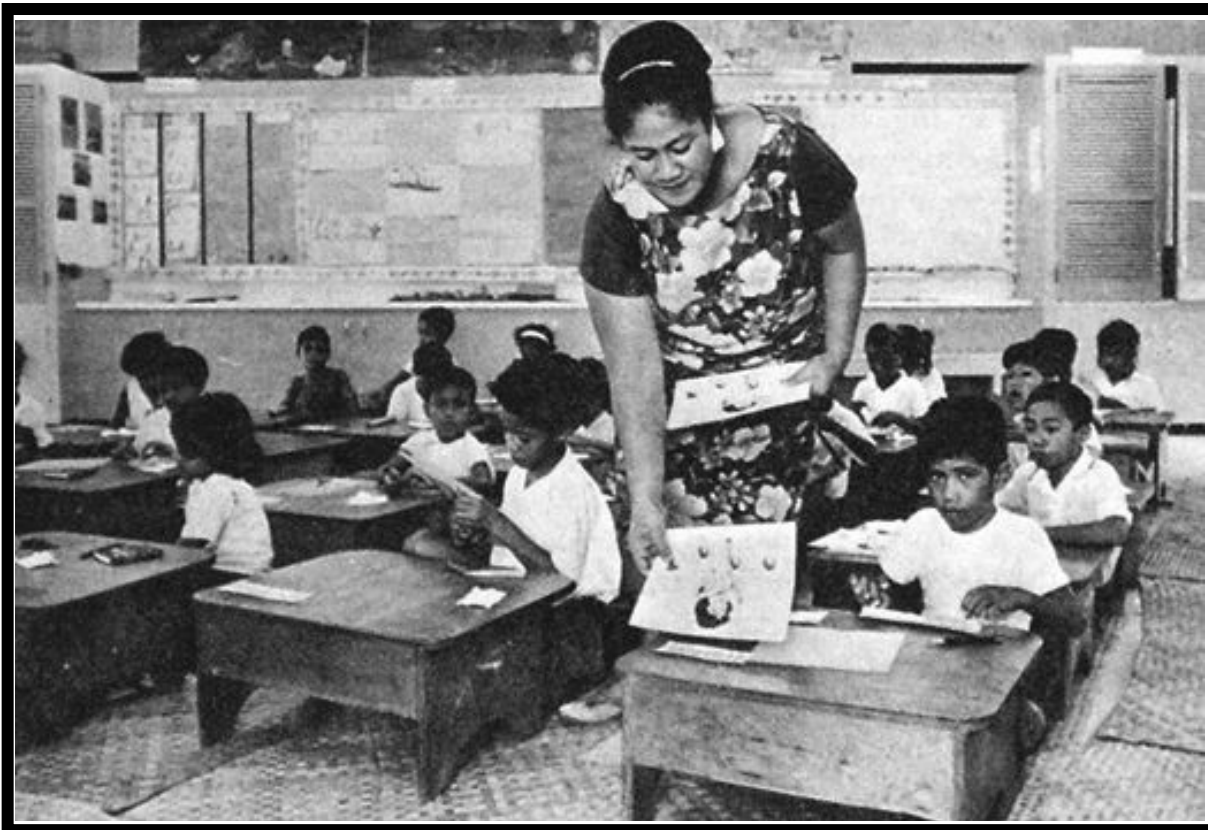
ASO O LE GAGANA TINA FAAVAOMALO (INTERNATIONAL MOTHER LANGUAGE DAY): O ataeao (21 Fepuari) e pa'u i ai le Aso Faailoga lena, e ave ai le faataua i le gagana i le fale a fanau, poo a latou gagana muamua. Toe o malo uma e faailogaina. Fai mai Nelson Mandela, "A e talanoa i se tagata i se gagana e malamalama ai, e sao lea i lona ulu, ae afai e te talanoa i ai i lana gagana, e sao lea i lona fatu." E moni lelei le upu. Oi, e te tau silafia le faia'oga?

E to'atele le mamalu o le atunuu, i pulea'oga, faia'oga ma faalapotopotoga tuma'oti ua faaoo atu ni a latou molimau faaleo, e lagolagoina ai se pili (tulafono taufaaofi) o loo opea nei i le palemene. O le pili lena e valaau ai mo se faamautinoaga o le iai ma tapenaina lelei o fale e nonofo ai fanau a le atunuu. To'atele ua mama'i ma maliliu nisi ona o le malulu o fale. E lagolagoina foi e le NZEI.