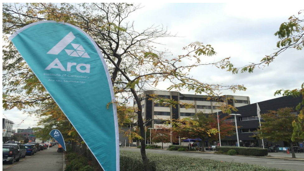
Se tasi lotoa a a'oga a le Ara i totonu o Karaiesetete.

mafaia ona ausia o le 85 pasene o kosi e mae'a lelei mai le 2013 e aulia le 2015.