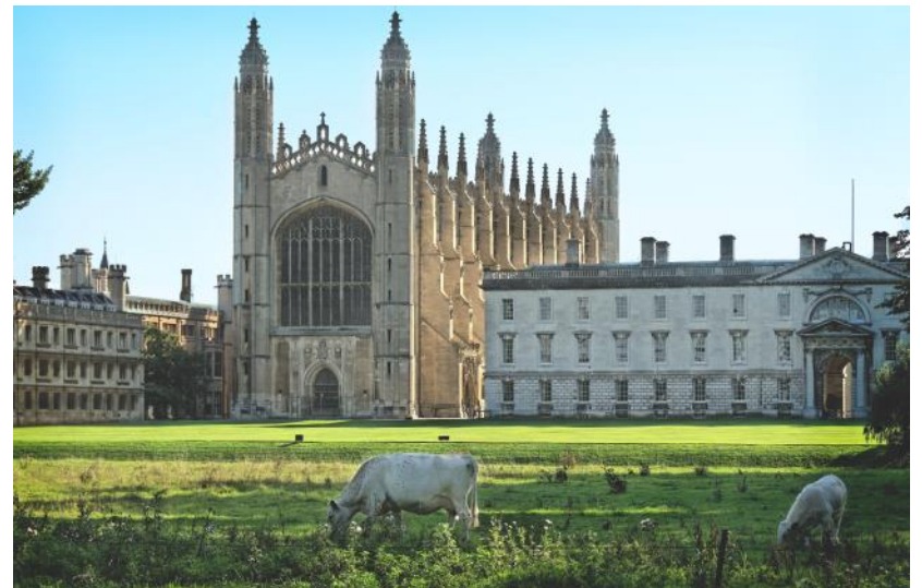
Foliga o le mea sili i le vaai a nisi matua, a'oga e a'o'oga ai fanau a tupu ma miliona; faatusa i povi pepeti ma mamoe taifulufulu

Ma o le popolega e moni lava mo le malo ma le Matagaluega, afai e alu a'i faapea, e iu ina tula'i mai se faiga e le ese ma lena sa tupu i Aferika i Saute, i le va o le lanu pa'epa'e ma isi lanu. Mo