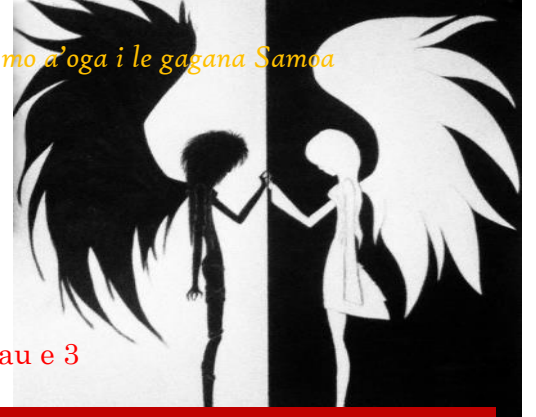
Itulau e 3

O se tasi o finauga faaauau pea o lena i le faapogai o lelei ma leaga i le sootaga ma le Atua le Afua Mea. E iai lenei faasoa faapitoa mo le Eseta o lenei foi tausaga.