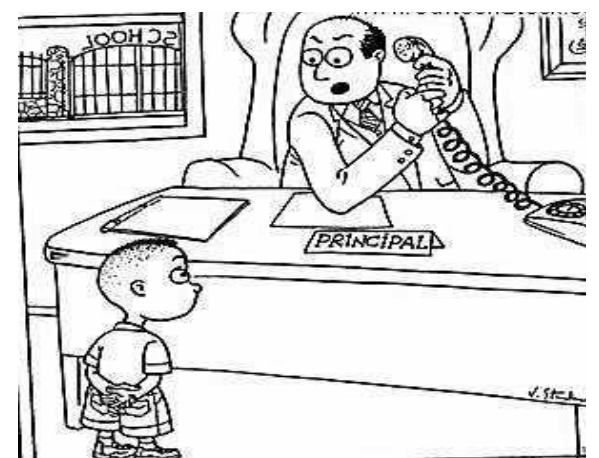
"Aua ne'i faaseseina oe Pole, e le o le a'oga ma le falea'oga, o le mea pa'epa'e lena e i lou ulu. O e malamalama?"

O le a taumafai e faaauau le faamatalaga o lenei lipoti a le Sunday Star Times i le isi lomiga a le OLA, e faailoa ai lagona o nisi o fanau ua omia i le va lea.