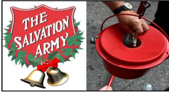
O se faalapopotoga lotu o loo toomaga i ai le to'atele o aiga Niu Sila i taimi o le mativa

E 5.7 pasene le siitaga o fale mautotogi i Aukilani lava ia mo le tolu potu moe, ae 6.9 pasene mo le lua potumoe.