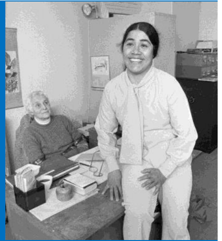
Le tama'ita'i o Falema'i Lesa

O se tasi o faaiuga tau faamasinoga e aafia ai le igoa Samoa o le a umi ona manatua, o lena sa faia i se falefaamasino i Peretania i le tausaga e 1982. E pei ona silafia